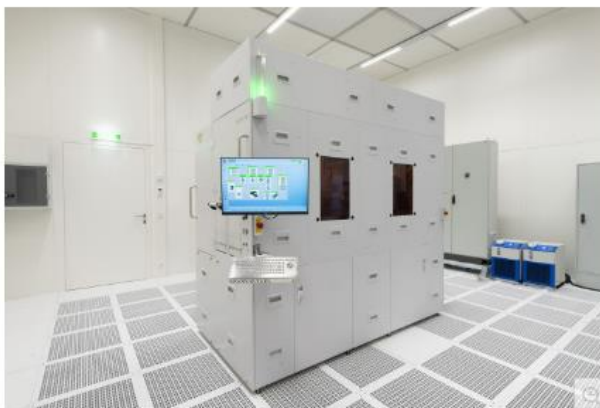
EV 그룹이 차세대 EVG150 레지스트 처리 플랫폼을 출시한다

서울--(뉴스와이어) 2022년 11월 08일 -- MEMS, 나노기술, 반도체 시장용 웨이퍼 본딩 및 리소그래피 장비 분야를 선도하는 EV Group (이하 EVG)이 회사의 리소그래피 솔루션 포트폴리오에 속하는 차세대 200mm 제품으로서 EVG®150 자동화 레지스트 처리 시스템을 출시한다고 밝혔다.