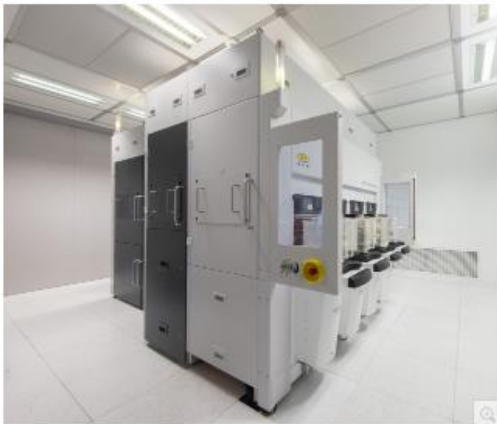
EVG®B50 NanoCleave™ 레이어 릴리즈 시스템은 나노미터 정밀도로 실리콘 기판에서 초박형 레이어를 분리할 수 있어 첨단 패키징 및 트랜지스터 스케일링을 위한 3D 집적에 혁신을 가져온다.

서울--(뉴스와이어)--MEMS, 나노기술, 반도체 시장을 웨이퍼 본딩 및 리소그래피 장비 분야를 선도하는 EV 그룹(이하 EVG)은 반도체 제조를 위한 혁신적인 레이어 릴리즈 기술 '나노클리브'™(NanoCleave)™를 출시한다고 밝혔다.