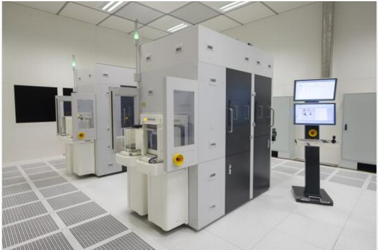
EVG®7300 SmartNIL®纳米压印和晶圆级光学系统

EVG7300是一款高度灵活的平台，提供三种不同的工艺模式（透镜成型、透镜堆叠和SmartNIL纳米压印），并支持从150 mm到300 mm的衬底尺寸。