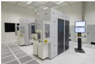
EVG®7300自动化SmartNIL®纳米压印与晶圆级光学系统在单个平台中结合了多种紫外光工艺，是一套先进的多功能解决方案。

2022年1月19日，奥地利莱茵弗里斯安 -- 微机电系统 (MEMS)、纳米技术和半导体市场晶圆键合与光刻设备领先供应商EV集团 (EVG) 现推出EVG®7300自动化SmartNIL®纳米压印与晶圆级光学系统。EVG7300是EV集团最先进的解决方案，在单个平台中结合了多种紫外光工艺，包括纳米压印光刻 (NIL)、透镜成型和透镜堆叠 (紫外光键合)。该面向行业的多功能系统旨在满足多种新兴应用的研究和生产需求。这些新兴应用大多涉及微米和纳米图案成型以及功能层堆叠技术，包括晶圆级光学系统 (WLO)、光学传感器和投影仪、汽车照明、增强现实耳机设备、生物医学设备、超透镜和超表面，以及光电子学应用。EVG7300支持最大300毫米晶圆尺寸，具有高精度调谐、先进工艺控制和高吞吐量等优势，可满足多种自由曲面和高精度纳米和微光学元件与器件的大批量制造需求。