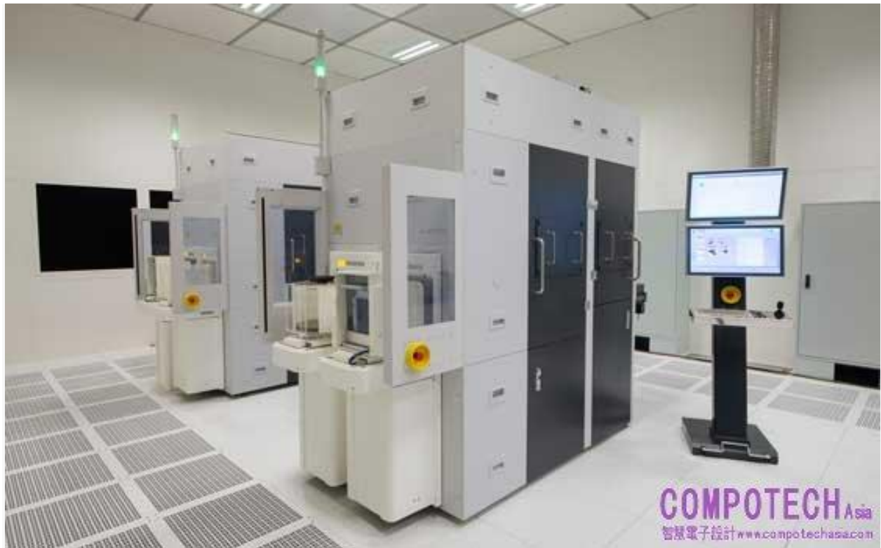
圖一_EVG®7300 SmartNIL®奈米壓印與晶圓級光學系統是具備多功能且先進的解決方案，可在單一平台上結合多重基於UV架構的製程。

EVG®7300是EVG最先進的解決方案，可在單一平台上結合奈米壓印微影技術、透鏡壓鑄與透鏡堆疊（UV接合）等多重基於UV架構的製程