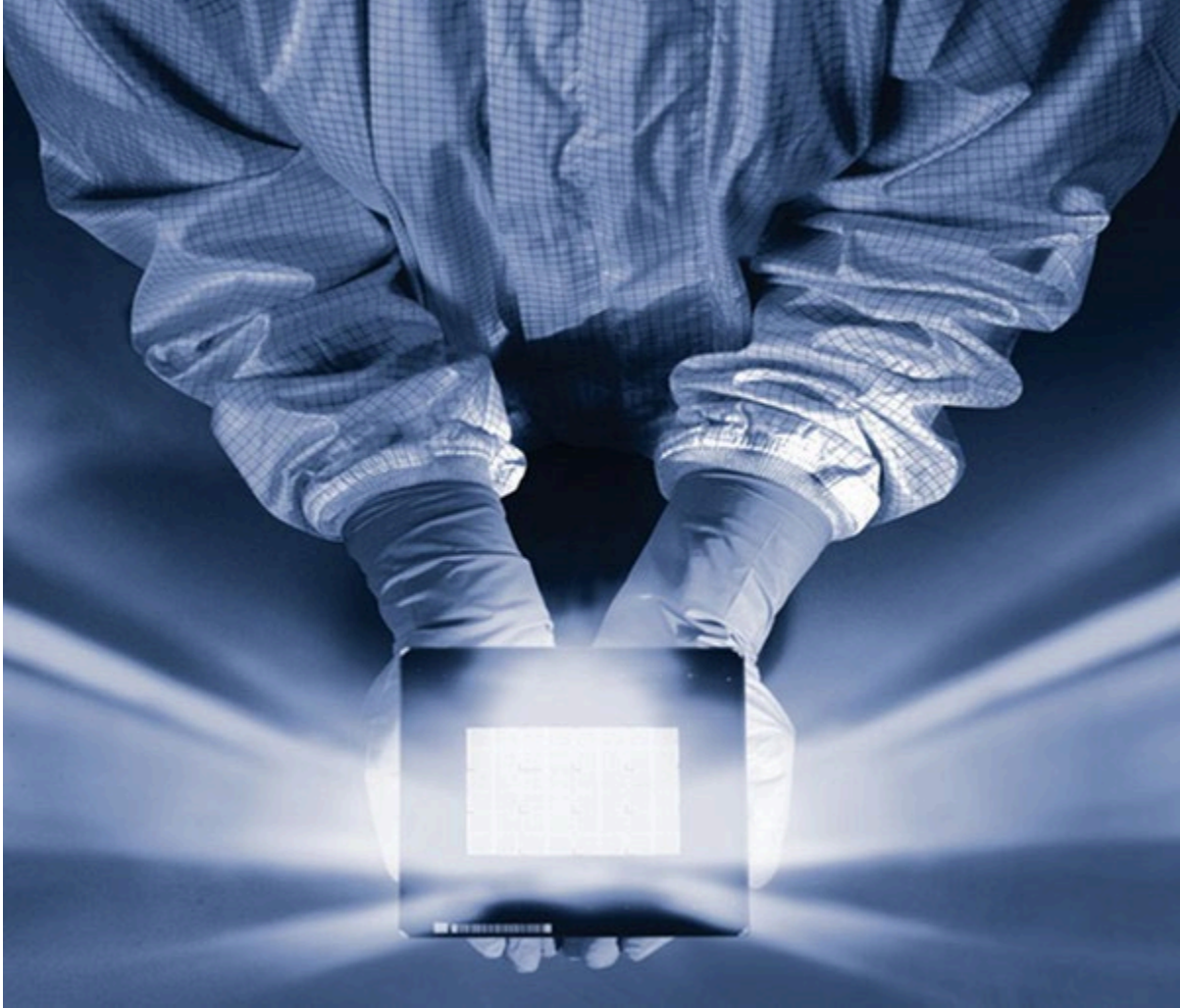
Toppan Photomask가 제조하는 반도체 산업용 포토마스크의 모습. 나노임프린트 리소그래피(NIL) 마스터는 동일한 재료, 기술 및 기술로 제조된다.