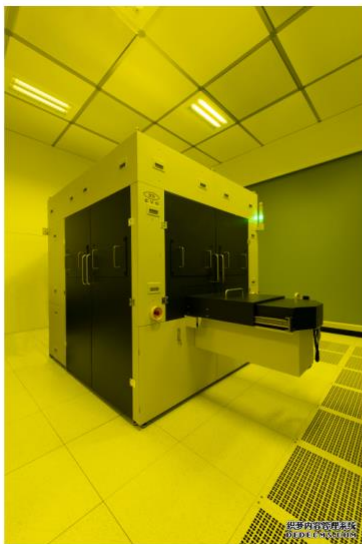
EVG@770 NT分步重复光刻纳米压印系统

2021年6月9日, 奥地利圣弗洛里安 - - 微机电系统 (MEMS)、纳米技术和半导体市场晶圆键合与光刻设备领先供应商EV集团 (EVG) 今天推出下一代分步重复光刻纳米压印 (NIL) 系统EVG@770 NT, EVG770 NT能够精确复制用于增强现实 (AR) 波导、晶圆级光学器件 (WLO) 和先进晶片实验室设备等批量生产应用中的大面积母版拼版的微纳图形。到目前为止, 由于大面积精确母版供应有限, 分步重复NIL的进一步发展和生产规模仍然受到制约。EV集团 (EVG) 利用NIL和分步重复制造领域的数十年经验, 将EVG770 NT设计为完全的生产导向型系统, 以最大限度地提升性能、生产率和过程可控性。EVG770 NT具备业内领先的覆盖精度和分辨率, 最大能够扩展至300毫米晶圆和第二代面板尺寸。利用这种先进系统, 客户能够更好地实现批量生产高成本效益、高保真NIL图案的承诺。