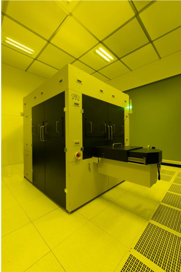
▲ 사진설명: EVG®770 NT 스텝-앤드-리피트 나노임프린트 리소그래피 시스템

EVG®770 NT, 증강현실 웨이브가이드, 웨이퍼 레벨 광학소자, 첨단 바이오메디컬 칩 제조에 이용