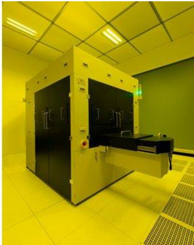
圖一_EVG®770 NT步進重複奈米壓印微影系統

EVG®770 NT為擴增實境波導管、晶圓級光學技術與先進生物醫學晶片 促成複雜的微型與奈米結構的大面積母模加工