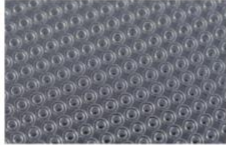
用于晶圆级光学器件的300毫米分步重复母模

晶圆级光学元件 (WLO) 是推动NIL普及的主要市场之一,从改进手机数码相机自动对焦功能,到用于提升智能手机安全性的面部识别,再到用于增强现实和虚拟现实 (VR) 耳机的3D建模与成像技术改进,WLO为移动消费电子产品开启了多种全新应用。分步重复NIL采用以电子束或其他技术写入的单片晶圆母模,在基板上进行多次复制,制造出大面积母模和模版,从而实现WLO生产以及用于微流控器件中使用的小型结构的高成本效益。由此产生的分步重复母模,可用于生产后续晶圆级和面板级制造的工作模版。