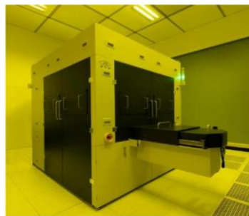
EVG@770 NT分步重复光刻纳米压印系统

2021年6月9日, 奥地利圣弗洛里安 - - 微机电系统 (MEMS)、纳米技术和半导体市场晶圆键合与光刻设备领先供应商EV集团 (EVG) 今天推出下一代分步重复光刻纳米压印 (NIL) 系统 EVG@770 NT。EVG770 NT能够精确复制用于增强现实 (AR) 波导、晶圆级光学器件 (WLO) 和先进晶片实验室设备等批量生产应用中的大面积母版拼版的微纳图形。到目前为止, 由于大面积精确母版供应有限, 分步重复NIL的进一步发展和生产规模仍然受到制约。EV集团 (EVG) 利用NIL和分步重复制造领域的数十年经验, 将EVG770 NT设计为完全的生产导向型系统, 以最大限度地提升性能、生产率和过程可控性。EVG770 NT具备业内领先的覆盖精度和分辨率, 最大能够扩展至300毫米晶圆和第二代面板尺寸。利用这种先进系统, 客户能够更好地实现批量生产高成本效益、高保真NIL图案的承诺。