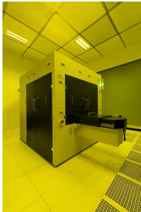
EVG EVGのステップ&リピート・ナノインプリント・リソグラフィ装置「EVG 770 NT」の外観

なお、「NILを半導体製造の微細プロセスへ適用する可能性はあるのか」と同社に確認してみたところ、同社からは「EVGは、NILを適用することが最適なマイクロ光学やフォトニクス市場に焦点を当てている。この技術は、バイオメディカル、ディスプレイや電子産業でも活用することができる。しかし、分解能や重ね合わせ精度の点で、半導体で超微細化を目指すEUV露光技術と競合することは考えてはいない。NILは、そのような超微細化を目指すのとは異なるさまざまな要求にこたえるための選択肢を広げる技術ととらえている」との回答を得ている。ナノインプリントを半導体製造に向けた超微細なプロセスとして活用することを目指して研究を進めているグループなどもあるが、分解能、アラインメント精度、異物微粒子による欠陥密度などの点で微細化になればなるほど適用が困難になっており、EVGでも半導体とは異なるデバイスへの適用を目指しているという。