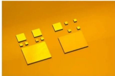
成功键合的3D片上系统 (SoC) 示例。

2022年7月27日, 奥地利弗洛里安——微机电系统 (MEMS)、纳米技术和半导体市场晶圆键合和光刻设备的领先供应商EV集团 (EVG) 今天宣布, 公司在芯片到晶圆 (D2W) 熔融与混合键合领域取得重大突破。EV集团在单次转移过程中使用GEMINI®FB自动混合键合系统, 在完整3D片上系统 (SoC) 中对不同尺寸芯片实施无空洞键合, 良率达到100%。直至今日, 此类键合仍是D2W键合领域面临的关键挑战, 也是降低异构集成成本的主要障碍。EV集团的异构集成技术中心 (HICC™) 取得了这一重大技术突破。该中心致力于帮助客户充分利用EV集团的工艺解决方案和专业知识, 通过系统集成和封装技术的进步, 加速开发创新产品和应用程序。