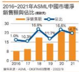
2016~2021年ASML中國市場淨銷售額與佔比

先前美國商務部長Gina Raimondo就曾在美國工業和安全局(BIS)會議中表示，幾乎全球和中國所生產的晶片都使用美國設備和軟體，美國政府可以讓任何向俄羅斯出售半導體的中國半導體業者停業(shut down)。美國智庫安全與新興科技中心(CSET)報告也指出，中國在半導體製造設備(SME)、電子設計自動化(EDA)軟體、矽智財(SIP)，和先進材料等方面的弱點，為美國政府提供可以對中國實施出口和投資限制的政策機會。